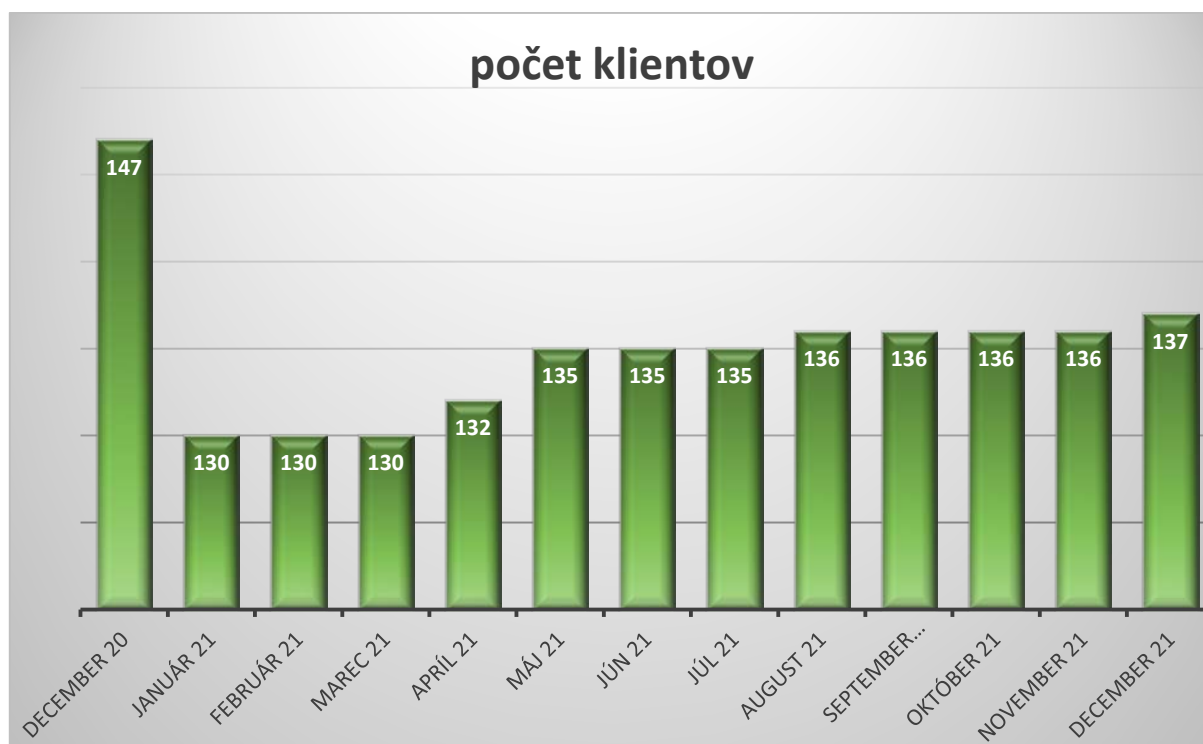
Graf 1 Vývoj počtu klientov OZV SLOVMAS, a. s. v roku 2021

V priebehu roka 2021 zabezpečila spoločnosť SLOVMAS, a. s. plnenie vyhradených povinností pre 140 klientov. K 31.12.2021 spoločnosť evidovala 137 klientov. Vývoj počtu klientov počas roka je znázornený na nasledujúcom grafe